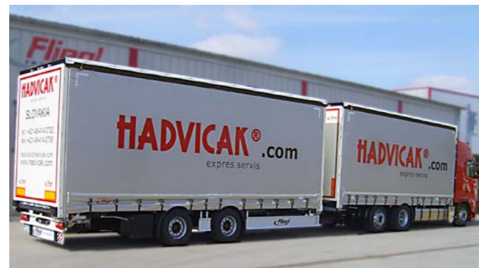
LKW-Zug mit Tandemanhängern in verschiedenen Aufbauhöhen und Konfigurationen.