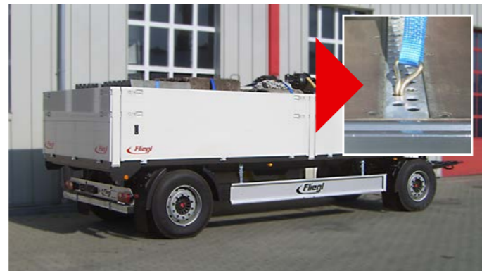
Drehschemel-Baustoffanhängers mit 18 Tonnen Gesamtgewicht mit serienmäßigen Lochprofil-Querleisten zur variablen Befestigung von Spanngurten.