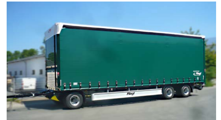
Dreiachs-Drehschemelanhängers in Jumbo-Ausführung.