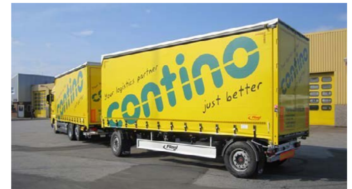
LKW-Aufbau mit Drehschemelanhängern.