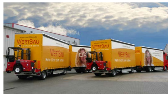
LKW-Züge mit Jumboanhängern inklusive Staplerhalterung.