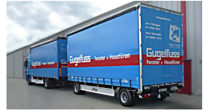
LKW-Zug mit Drehschemelanhängern und Staplerhalterung.