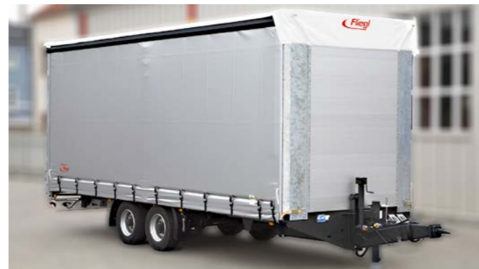
Speditionsanhängers bis 13,5 Tonnen Gesamtgewicht, wahlweise mit Schiebegardinen- oder Plane-Spiegel-Aufbau.