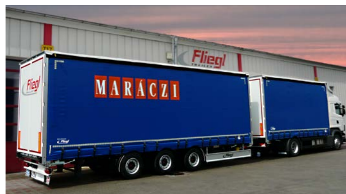
LKW-Zug mit Tridemanhängern.