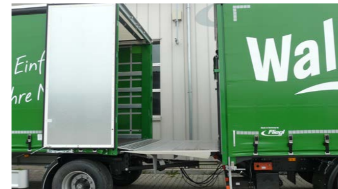
Kein Rangieren, nur ein Rampenstellplatz, kürzere Ladezeit: Mit Hilfe eines Durchladesystems können LKW und Anhänger in einem Arbeitsschritt be- und entladen werden.