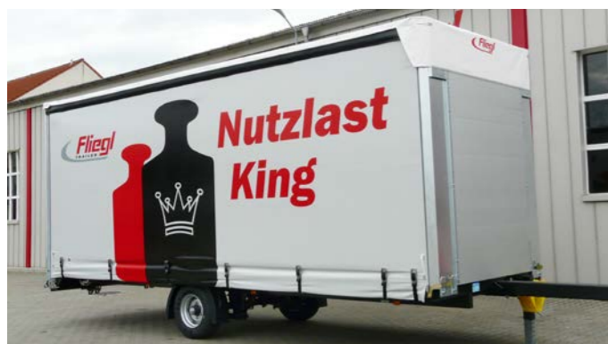
Fliegl's Nutzlast King, ein Plattformanhängers mit Schiebegardinenaufbau, wiegt weniger als 2 Tonnen. In Verbindung mit einem 7,5 Tonnen-LKW entsteht ein Zug, der unter der Mautgrenze von 12 Tonnen bleibt.