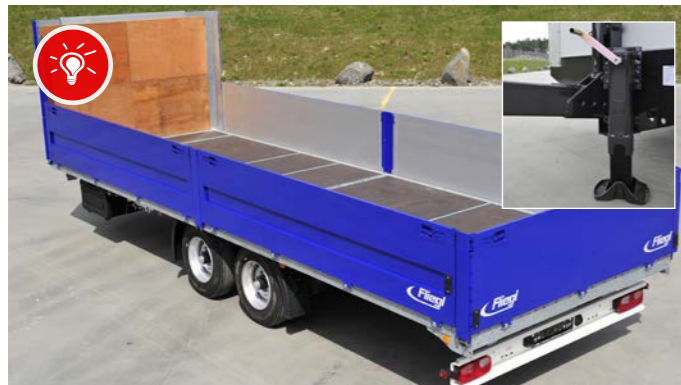
Baustoff-Tandemanhängers mit 8,9 bis 18 Tonnen Gesamtgewicht.