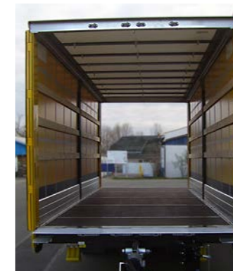
Ein Durchladesystem stellt die überfahrbare Verbindung zwischen LKW und Anhänger her.