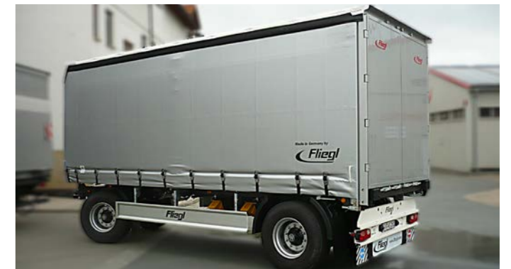
Zweiachs-Drehschemelanhängers mit Schiebegardinenaufbau.